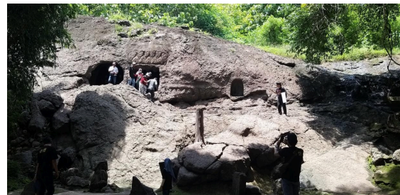
Gambar 2. Jalan masuk ke dalam area Gua Selomangleng, Kediri

alam serta leluhur. Selomangleng (Gambar 2) menampilkan karakter khas tersebut melalui relief-reliefnya yang menggambarkan kisah-kisah moral dan spiritual, serta melalui posisinya sebagai tempat pertapaan yang sejak lama digunakan untuk praktik-praktik pencarian jati diri, juga dapat menjadi bukti bahwa kebudayaan yang ada di Indonesia sudah ada sejak zaman dahulu, serta kedepannya hal tersebut mampu menjadi dasar agar generasi yang akan datang tidak mudah melupakan kebudayaan yang sudah ada (Sari et al., 2023).