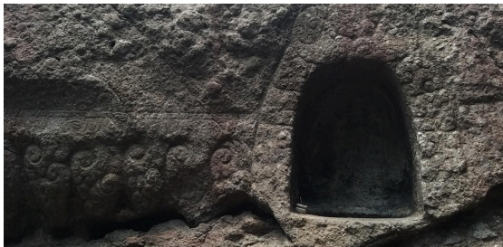
Gambar 1. Detail Gua Selomangleng, Kediri

ruang kuno di Nusantara, Selomangleng memuat lapisan-lapisan jejak yang menunjukkan hubungan panjang antara manusia, alam, dan sistem kepercayaan lokal. Jejak ini tampak dalam pahatan batu yang telah aus, dinding gua yang menghitam karena waktu, bagian-bagian ruang yang menunjukkan aktivitas ritual, serta atmosfer hening yang menyelimuti seluruh ruang gua. Setiap bagian dari Selomangleng mengandung tanda-tanda kehadiran masa lampau, tanda yang tidak selalu dapat dijelaskan melalui fakta arkeologis saja, tetapi hidup dalam pengetahuan lokal dan narasi budaya yang terus diwariskan (Wahyuni et al., 2024). Dengan demikian, jejak di Selomangleng adalah bukti kehadiran manusia dan praktik spiritual, tetapi sekaligus juga jejak makna, yaitu tanda-tanda yang menunjukkan bagaimana masyarakat memaknai ruang tersebut dalam kosmologi mereka.