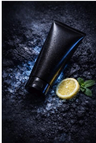
Gambar 3. Hasil Promopting pada ChatGPT. Diambil pada 24 Februari 2026.