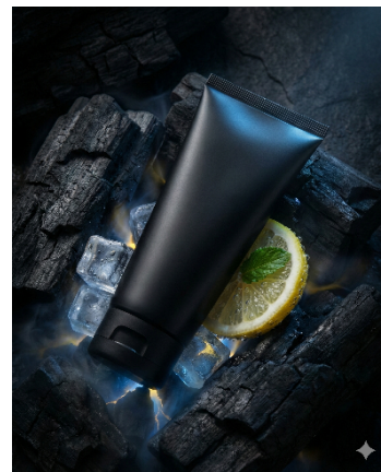
Gambar 2. Hasil Prompting pada Nano Banana, Gemini AI milik Google. Diambil pada 24 Februari 2026.