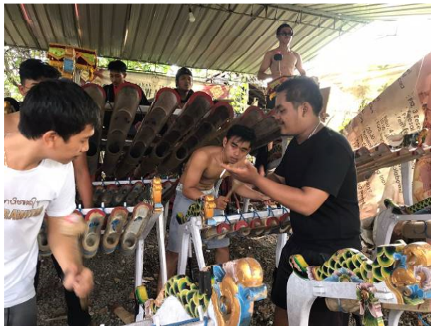
Gambar 1. Proses Latihan Komposisi Jegog

pemotongan atau penambahan struktur lagu/gending sesuai dengan kebutuhan kompositoris; 3). Ngalusin adalah tahap merumuskan hal-hal detail dalam penciptaan karya karawitan. Ngalusin berarti menghaluskan atau menjadikan halus, memberikan nafas pada gending dan hal-hal lain yang bersangkutan dengan kebersihan hasil karya. Penjiwaan pada lagu/gending juga dilakukan dalam proses ngalusin ; 4). Ngungkab rasa adalah tahapan memberikan penekanan-penekanan teknik untuk membangkitkan rasa dari bentuk-bentuk kongkrit yang masih terasa kaku. Menitik beratkan pada perbaduan antara pemahaman dan penghayatan, ketika sebuah struktur dan formulasi yang telah dipahami dan selanjutnya dapat dihayati untuk menghadirkan inti yang disematkan pada tiap bagian lagu.