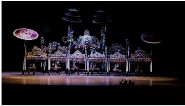
Gambar 2. Pementasan Jegog Dalam Acara Ujian Tugas Akhir, 11 Januari 2022

Karya komposisi ini saya sebut sebagai karya komposisi petegak kreasi karena menggunakan struktur tabuh petegak klasik dan terdapat pembaharuan di dalamnya sehingga dapat dikatakan bahwa komposisi ini mengandung unsur kreasi di dalamnya. Secara sederhana komposisi petegak merupakan sebuah gending yang digunakan untuk mengundang penonton dalam pertunjukan jegog sebelum akhirnya pementasan tersebut berujung kepada mebarung , yaitu sebuah ajang kontestasi dalam pementasan gamelan jegog yang bertitik fokus pada volume suara gamelan yang keras. Dari beberapa orang pecinta jegog memang mereka menyaksikan pertunjukan Jegog semata mata untuk melihat pertunjukan mebarung , sehingga bagian mebarung pada karya ini juga sangat penting sebagai identitas jegog itu sendiri. Notasi mebarung seperti dibawah ini.