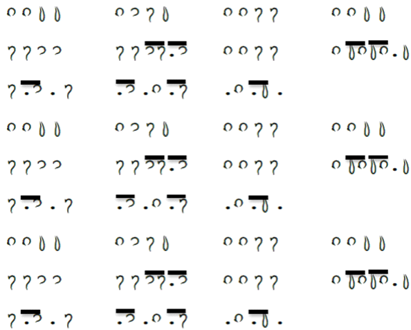
Gambar 4. Notasi Komposisi Tabuh Petegak Kreasi Ngakit

saya jelaskan diatas tentunya harus mengamati atau mendengarkan karya musik yang telah ada, dari sekian banyak komposisi petegak yang ada di dalam ensambel gamelan jegog hampir semuanya menggunakan teknik ngotek dan teknik nyelangkit tersebut. Notasi kotekan sebagai berikut.