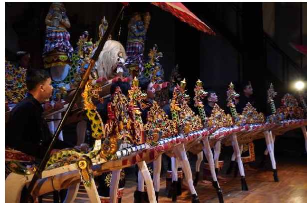
Gambar 7. Pentas Jegog tampak samping