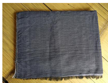
Gambar 2. Tenun Aros

Motif Samping Aros terdiri dari warna hitam dengan garis-garis putih yang tipis. Jarak dan ukuran antara garis satu dengan yang lain berbeda-beda setiap kainnya. Ini menandakan hirarki kaum pria Baduy Dalam. Semakin renggang jaraknya maka semakin tinggi posisi yang diduduki.