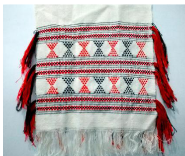
Gambar 3. Tenun Adu Mancung

Tenun Adu Mancung memiliki arti “ujung ke ujung”, mengindikasikan pada bentuk segitiga yang ujungnya saling bertemu. Sejalan dengan arti motifnya, selendang ini mengandung makna harapan agar kedua mempelai dapat bersatu dalam ikatan rumah tangga yang damai dan langgeng.