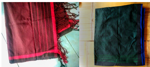
Gambar 5. Poleng Kacang Hereng dan Manggriib

Poleng memiliki beragam jenis motif kotak dengan berbagai macam ukuran. Warna dari tenun ini cenderung gelap, seperti warna hitam dan hijau atau hitam dan biru dan hitam merah. Warna tersebut mengindikasikan fungsi dari masing-masing tenun. Misalnya, tenun Poleng yang digunakan untuk pakaian sehari-hari adalah Poleng yang berwarna hitam biru sedangkan untuk upacara kematian adalah tenun Poleng yang lebih condong ke warna merah. Hal ini disebabkan oleh aturan yang sudah ada sejak dulu dan harus diikuti.