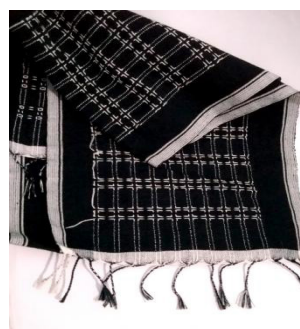
Gambar 4. Tenun Suat Songket (Foto: Ari Arini, 2019)

Sekarang ini kain tenun motif Suat Songket sudah memiliki variasi yang sangat beragam baik dari segi warna maupun ukurannya. Karena tenun Suat Songket merupakan salah satu tenun yang paling banyak diminati oleh wisatawan sebagai cinderamata dari kampung Baduy sehingga ragam hiasnya pun semakin banyak. Kemudian, dengan banyaknya ragam hias yang terlahir.