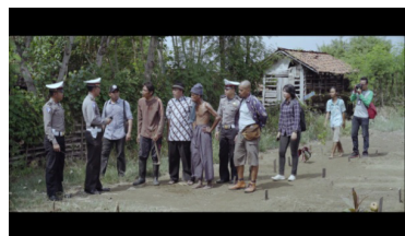
Gambar 3. Makam