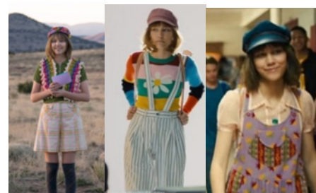
Gambar 2: Karakter Susan Caraway dalam film Disney Star Girl