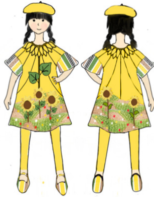
Gambar 17: Ilustrasi desain 3