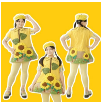
Gambar 18: Foto model desain 3