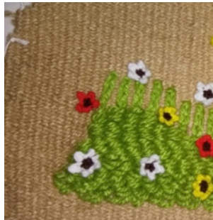
Gambar 9: Tapestri

dunia fashion, istilah tapestri melukiskan suatu desain berat dengan hiasan bunga timbul diatas bahan. Busana Tapestri populer secara singkat selama tahun 1960-an. (Poespa, Goet. 2009)