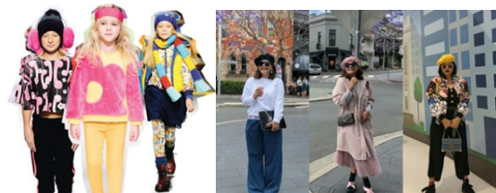
Gambar 1 : Contoh artsy style

Artsy style merupakan gaya yang senang bereksperimen dengan item fashion. Artsy style sering memadukan penggunaan warna cerah hingga aksesoris yang nyeleneh, memadukan warna yang bertabrakan, dengan warna-warna cerah dan sebagian besar aksesoris adalah buatan tangan dan kain buatan tangan.