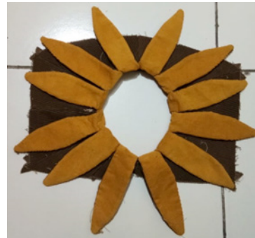
Gambar 11: Contoh Pattern Magic

desain pola datar dan konstruksi sempurna. (Nakamichi, Tomoko.2010)