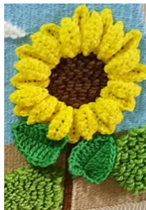
Gambar 10: Rajutan bunga matahari diatas tapestri

Rajut adalah seni dekoratif yang diciptakan dengan membuat sengkeli dengan menggunakan jarum/pena pengait khusus yang disebut hakpen. Dekorasi ini sering digunakan pada syal dan selimut. (Poespa, Goet. 2009)