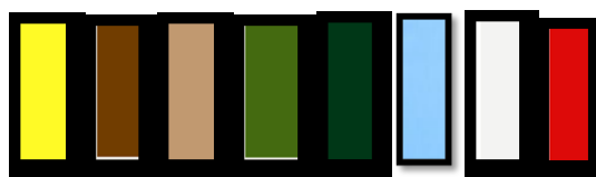
Gambar 3 : Wana-warna yang digunakan

Semua warna kuning akan menjadi tren pada tahun 2022, termasuk warna kuning marigold, lemon, buttercup, madu, pisang, dan daffodil . Pada karya " Perancangan Busana Anak Panggung dengan Sumber Ide Bunga Matahari " fokus pada warna kuning serta kombinasi warna- warna lain seperti cokelat, hijau, biru muda, merah, dan putih. (Ichsan,Intan Riskina. 2021).