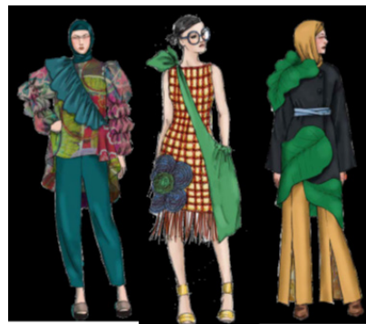
Gambar 12: Ilustrasi Trend Exploitation

Kerinduan untuk tampil dengan meriah, optimis, cenderung berlebihan tergambarkan dalam tema exploitation . Unsur berlebihan mendominasi tema ini, baik dalam detail, bentuk, dan penerapan ukuran. Dramatis dalam gaya terlihat pada tampilan yang menggabungkan berbagai elemen, motif dengan paduan warna yang bertabrakan bahkan terkesan kacau.