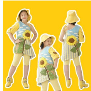
Gambar 14: Foto model desain 1