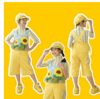
Gambar 16: Foto model desain 1