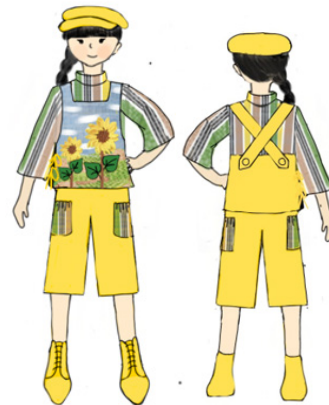
Gambar 15 : Ilustrasi desain 2