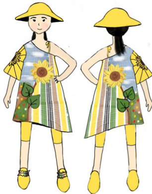
Gambar 13: Ilustrasi desain 1