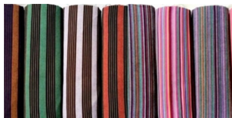
Gambar 4: Kain lurik

Kain lurik merupakan kain yang dibuat menggunakan benang katun yang dipintal menggunakan Alat Tenun Bukan Mesin (ATBM). Ciri dari kain lurik adalah terbuat dari benang katun, kalau menggunakan benang sintetis, maka kain yang dihasilkan tidak dapat disebut kain lurik lagi karena karakter kain lurik yang khas sudah hilang. Kain lurik memiliki tekstur yang khas ketika disentuh. (Gunawan, Belinda dkk. 2009)