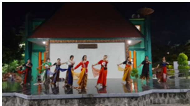
Gambar 1. Explore Sekaran Garapan Tari Sesaji

Tahap selanjutnya membicarakan rencana pentas dari hasil pelatihan Garapan tari Sesaji yang diberi judul “Nur Citra Laksita”.