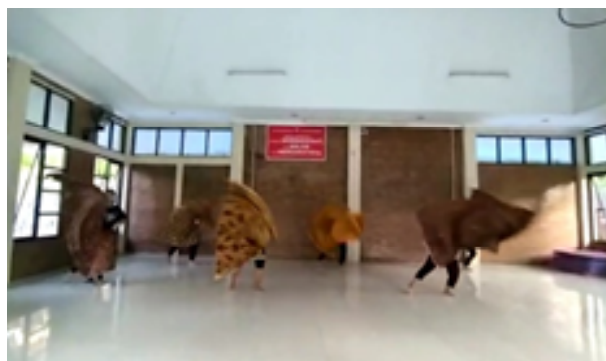
Gambar 2. Explore Rampak Banyu

Pelatihan garapan Wayang Bocah sebagai sasaran adalah guru dan siswa sanggar. Pelatihan ini diharapkan para guru dan siswa sanggar lebih bisa mengenal bentuk kreativitas dalam sebuah penggarapan dalam bentuk dramatari. Hasil akhir para guru dan siswa sanggar akan mampu berkreasi dalam mengembangkan dan meningkatkan kualitas nama sanggar, serta mampu menjadikan Sanggar Sang Citra Budaya menjadi sanggar yang kreatif dan inovatif. Pelaksanaan pelatihan diawali dengan Tutor memberikan pengantar singkat sebagai pembuka perkenalan dengan siswa sanggar yang belum terlibat, pembuatan absensi pelatihan, jadwal pelatihan, pembahasan cerita, pembagian casting peran yang disesuaikan dengan kualitas kemampuan kepenarian dan karakter yang dimiliki oleh masing-masing para siswa sanggar. Pelatihan diawali dari penari Rampak banyu, rampak Ulo. Rampak Banyu mengeksplorasi gerak-gerak dengan menggunakan kain sebagai properti, seperti: kaki trancing, membentangkan kain didepan, digetarkan, mengayun, melempar ke kanan ke kiri, nyaut putar dengan mengayun kain, duduk membentangkan kain didepan digetarkan, diputar ke belakang, berdiri melempar kain dengan melingkari tubuh, srisig sambil membentangkan kain, memecah dua arah, srisig tangan ke atas sambil miwir kain.