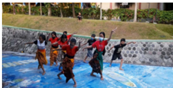
Gambar 3. Explore Rampak Ulo

Rampak Ulo mengeksplorasi gerak-gerak seperti ular seperti: bentuk jari-jari tangan nogorangsang, posisi tangan bokor sinonggo, kaki silang, melengguk, junjung ngancap tangan bergerak sandal pancing, srisig, menggebrak, srisig membentuk ular dengan saling berpegangan pegang lawan, badan meliuk-liuk dengan kepala ulo nglangi, jinjit, tangan nogo rangsang, menyepak, membentuk pose bertingkat, berdiri, tekuk lutut dan jengkeng dengan tangan di depan menyilang, kepala bergerak ulo nglangi.