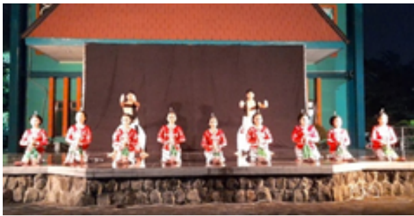
Gambar 6. Pentas Garapan Tari Sesaji di Panggung Terbuka Taman Cerdas Surakarta. 19 Oktober 2021