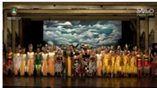
Gambar 8. Pentas Wayang Bocah “Dewaruci” di gedung Wayang Orang Sriwedari.

dipentaskan dalam rangka Festival Wayang Bocah yang di selenggarakan pada tanggal 7 November 2021 di gedung Wayang Orang Sriwedari. Pentas secara virtual dengan media social YouTube. Garapan ini menceritakan Brotoseno yang diberi arahan Guru Durna untuk nggayuh gong susuhing angin . Garapan dengan tokoh Dewaruci, Brotoseno, kunti, Rukmoko, Rukmokolo, limbuk, cangik dan di dukung oleh garapan kelompok yaitu, rampak ulo, rampak banyu, rampak bedayan, rampak hewan dan rampak tumbuhan.