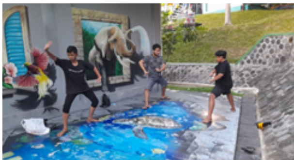
Gambar . 4. Explore Gerak Tokoh

hoyogan, junjungan, lumaksana, jomplangan, gedegan. Tokoh Buto, mencoba bergerak seperti: bentuk tangan nogo rangsang, tanjak bapang, lumaksana, sabetan, gedegan banteng gambul, sautan, latihan antawecana. Tokoh Kunti, kipat srisig, lumaksana lembahan, ulap-ulap tawing, kebyok kebyak sampur, hoyogan ,laras mangling, sindet, ukel karno, ngayang seblak dua sampur, pose-pose, latihan tembang ,antawecana. Tokoh Dewaruci, latihan gerak-gerak, seperti gerak Bima, , tanjak kambengan, hoyogan ,sabetan, lumaksana, junjungan, jomplangan, gedegan, jari-jari kepel.