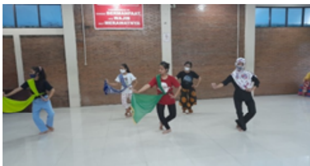
Gambar . 5. Explore Gerak Rampak Bedayan

Rampak Bedayan diawali dari: jalan kapang-kapang, kipat srisig, sindhet, golek iwak glebagan, ngigel srisig ngrekatha, sndhet, lembahan wutuh, hoyog, laras mangling, sindhet, hoyog, srisig sampir sampur, kebyak sampur, jengkeng nikelwarti, tetembangan manembah, srisig kepojok ngayang balik srisig maju, jengkeng nikelwarti datang tokoh Brotoseno, antawecana, Kunti nembang, bedayan berdiri srisig ngrekatha srisig.