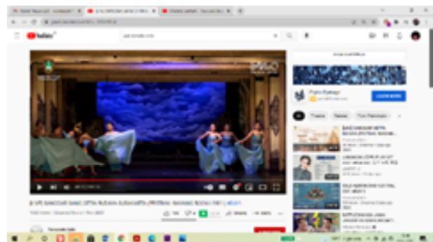
Gambar .9. Hasil Pelatihan yang di publikasikan di Media Sosial YouTube.