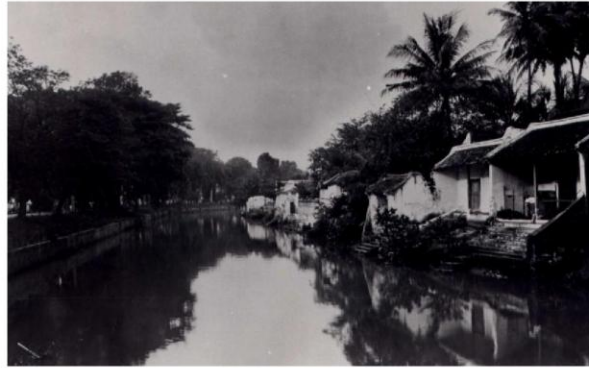
Gambar 1. Sungai Lodji yang membelah kota Pekalongan pada sekitar tahun 1930 an, yang merupakan urat nadi pendistribusian bahan batik.