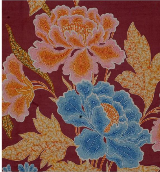
Gambar 3. Salah satu detail buketan yang sangat luar biasa, yang menjadi ciri khas buatan Oey Soe Tjoen . (Dok : Jauhari, 2008).