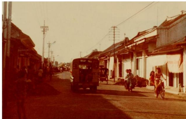
Gambar 2. Daerah Kedungwuni pada sekitar tahun 70 an, masih kelihatan lengang. (Repro: Jauhari, Dok. Keluarga, 2008).

Kedungwuni sebagai sentra daerah pembatikan yang merupakan daerah penyangga batik Pekalongan, sejak zaman sebelum kemerdekaan sudah merupakan daerah yang terkenal akan kualitas tingkat kehalusan dalam hal pengerjaan batik. Di samping itu juga keberadaan etnis Cina juga sangat berperan dan cukup mendominasi perkembangan batik yang ada di Kedungwuni.