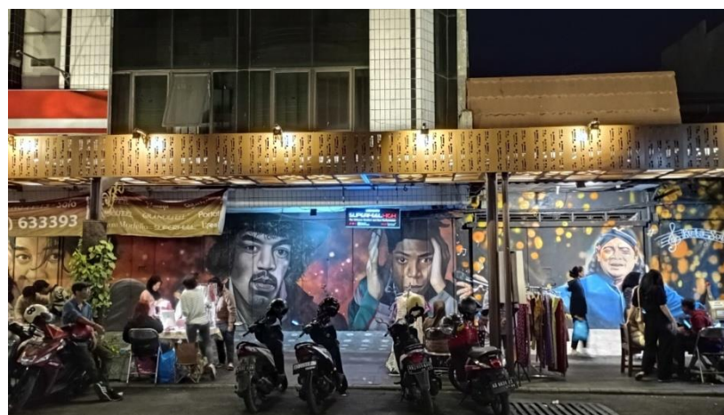
Gambar 1.4. Motif Parang pada sisi depan kanopi

Tidak hanya pada bagian langit-langit, inspirasi motif batik yang divisualkan pada kanopi di sepanjang koridor juga ditambahkan pada bagian sisi depan kanan dan kiri koridor. Motif Batik Parang ditambahkan dengan aksesoris yang klasik dan dinamis. Satu ornamen motif kawung dibuat sejajar vertikal dan dibuat berirama dengan direpetisi secara silang pada sisi kanan dan kiri motif (Doellah, 2012) dan. Teknik penataan motif Parang umumnya direpetisi berbaris miring sebesar 45 derajat, tetapi pengaplikasian pada kanopi koridor lebih dibuat bebas. Penonjolan motif dibuat dengan cara dipotong, sehingga berlubang pada bagian permukaan dan memotong bagian dalam motif, baik pada motif Parang ataupun Kawung.