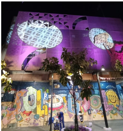
Gambar 1.5. Lampu sorot dan mural dengan inspirasi motif batik