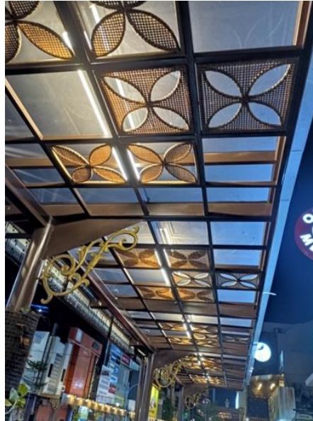
Gambar 1.3. Foto kanopi koridor Gatot Subroto

Tidak hanya pada bagian langit-langit, inspirasi motif batik yang divisualkan pada kanopi di sepanjang koridor juga ditambahkan pada bagian sisi depan kanan dan kiri koridor. Motif Batik Parang ditambahkan dengan aksesoris yang klasik dan dinamis. Satu ornamen motif kawung dibuat sejajar vertikal dan dibuat berirama dengan direpetisi secara silang pada sisi kanan dan kiri motif (Doellah, 2012) dan. Teknik penataan motif Parang umumnya direpetisi berbaris miring sebesar 45 derajat, tetapi pengaplikasian pada kanopi koridor lebih dibuat bebas. Penonjolan motif dibuat dengan cara dipotong, sehingga berlubang pada bagian permukaan dan memotong bagian dalam motif, baik pada motif Parang ataupun Kawung.