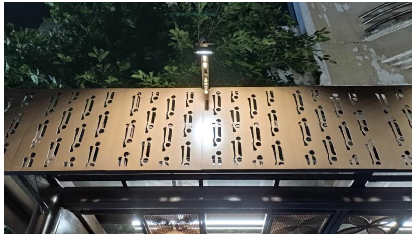
Gambar 2.3. Detail Motif Parang pada sisi depan kanopi