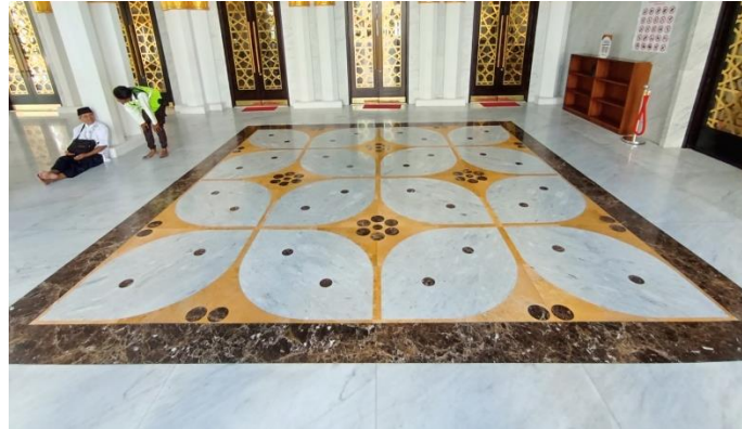
Gambar 1.2. Lantai Masjid Raya Sheikh Zayid Solo bermotif batik