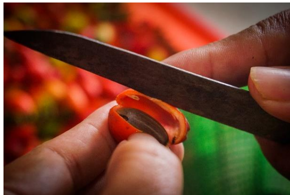
Gambar 2. Mengupas Melinjo: Sentuhan Awal Menuju Emping

Foto ini merekam tahap awal produksi emping, yaitu proses pengelupasan kulit melinjo secara manual yang membutuhkan ketelatenan agar biji tetap utuh. Diambil pada pukul 13.35 WIB dengan teknik close-up dan pendekatan EDFAT ( detail ), foto menyoroti tangan Bu Mulyani saat membelah kulit buah menggunakan pisau, menampilkan detail tekstur jari, permukaan biji, dan kontras warna alami melinjo. Latar belakang sengaja dibuat blur untuk menegaskan fokus pada aktivitas utama. Pencahayaan memanfaatkan flash eksternal berintensitas rendah-sedang dari samping untuk memperjelas tekstur tanpa menghilangkan kesan alami. Data teknis: ISO 500, f/5.6 , 1/40s .