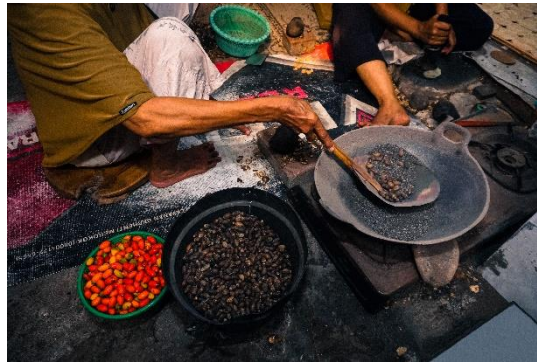
Gambar 3. Dari Tangan ke Rasa: Cerita Emping Melinjo Bu Sum di Kartasura

Foto ini mendokumentasikan suasana dapur tradisional pada pukul 09.30 WIB, ketika dua perempuan terlibat dalam proses penyangraian dan penumbukan biji melinjo. Di sisi kiri tampak aktivitas mengaduk biji dengan serok logam di atas wajan berisi pasir panas, sementara di sisi kanan biji yang matang dipipihkan menggunakan alat tumbuk tradisional. Pengambilan gambar menggunakan teknik EDFAT ( angle ) dengan medium shoot dan sudut pandang eye level , menampilkan interaksi subjek, alat tradisional, serta lingkungan produksi secara kontekstual. Pencahayaan dibantu flash eksternal berintensitas sedang untuk menyeimbangkan cahaya ruangan, mempertegas detail tekstur, namun tetap menjaga nuansa hangat dan autentik dapur tradisional. Data teknis: ISO 1250, f/4, 1/100s.