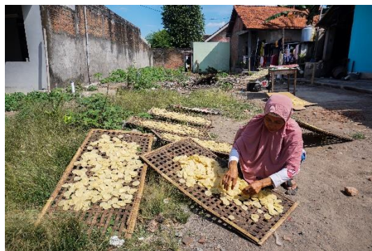
Gambar 6. Proses Pengeringan Emping di Halaman Rumah