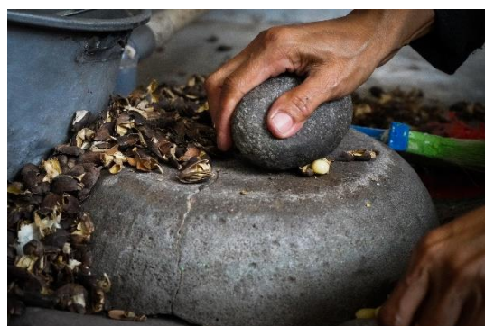
Gambar 4. Dari Cangkang ke Inti

Foto ini menampilkan detail proses pengupasan kulit melinjo secara tradisional oleh Bu Sum, dilakukan dengan batu cobek dan batu bulat sebagai alat bantu. Diambil pada pukul 09.10 WIB dengan teknik EDFAT ( detail ) dan close-up , foto menonjolkan tekstur tangan, batu, serta kulit