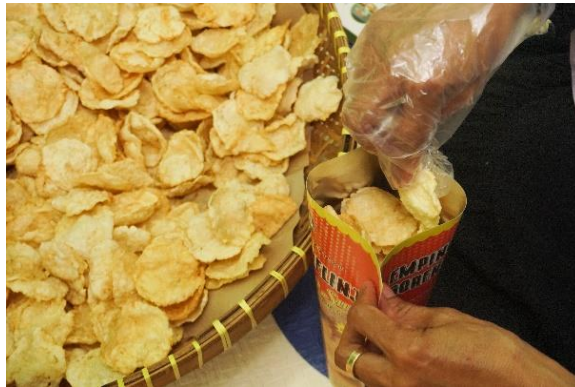
Gambar 8. Sentuhan Terakhir dalam Setiap Lembar

Foto ini menampilkan Bu Sum dan Pak Sumarno saat mengemas emping melinjo, tahap akhir yang menentukan mutu dan nilai jual produk. Diambil pukul 14.27 WIB dengan ISO 1000, diafragma f/5.6, dan kecepatan rana 1/50 detik, foto menggunakan teknik EDFAT ( top angle ) serta medium close up untuk menonjolkan detail tangan dan kemasan. Dengan bantuan flash eksternal intensitas sedang, tekstur emping dan kerapian proses tergambar jelas, menghadirkan kesan otentik tentang tradisi, ketelitian, dan semangat kewirausahaan lokal.