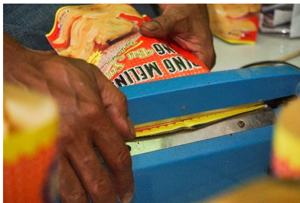
Gambar 9. Karya Foto 8. Sentuhan Terakhir dalam Setiap Lembar

Foto ini merekam tahap akhir produksi emping melinjo Bu Sum saat kemasan disegel menggunakan alat press plastik. Diambil pukul 14.34 WIB dengan pengaturan ISO 500, diafragma f/5.6, dan kecepatan rana 1/50 detik, foto menggunakan teknik EDFAT pada tahapan framing serta pendekatan close up untuk menyoro detail tangan, alat penyegel, dan kemasan berlabel.