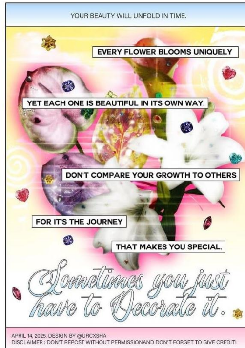
Gambar 1. Poster Every Flower Tells a Story , Tahun 2025

Poster bertema Y2K bukan sekadar kumpulan elemen dekoratif retro, melainkan suatu bahasa visual yang kohesif yang menyatukan berbagai aspek: nostalgia era digital awal, eksperimen bentuk-bentuk abstrak, serta ekonomi perhatian ( attention economy ) di media sosial. Karya ini memiliki nilai strategis, tidak hanya dalam merepresentasikan suatu tren estetika, tetapi juga sebagai media penyampai pesan yang relevan dengan kondisi psikologis dan sosial audiens muda, seperti tekanan untuk tumbuh dan perbandingan sosial. Adapun komponen dan karakteristik visual poster Y2K yang dianalisis di antaranya adalah palet warna yang mencolok dan futuristik. Warna-warna seperti cyan terang, magenta, silver, dan kuning neon menjadi representasi dari energi, teknologi, dan optimisme masa depan ala tahun 2000-an. Tidak hanya terbatas pada warna solid, penggunaan gradien warna yang halus hingga tajam juga menjadi ciri khas yang membedakannya dari gaya desain lain.