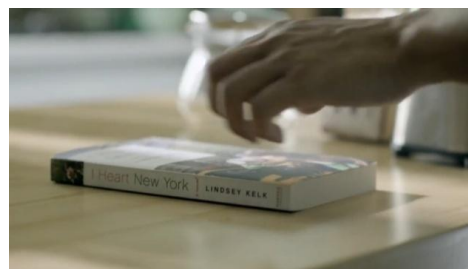
Gambar 3. Rio Dewanto meletakkan buku bacaannya Time Code : 00.13

sebagai sosok perempuan yang peduli terhadap kesehatannya sendiri. Sedangkan Rio Dewanto mengamati dan berusaha memahami hal apa yang akan dia lakukan ketika Dea Valencia sedang berlatih yoga. Konotasi makna yang lain juga ditemukan dalam gambar di atas, dimana olahraga yoga identik dengan olahraga yang digemari kaum kelas menengah yang sedang menjalankan program diet atau hanya sekedar untuk mengecilkan paha dan perut. Di sisi lain, tempat yang ia gunakan untuk senam yoga langsung menghadap ke arah kolam renang. Rumah yang mempunyai kolam renang pribadi sarat dengan konstruksi masyarakat kaum borjuis.