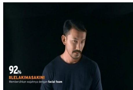
Gambar 1. Memperkenalkan lelaki masa kini Time Code : 00.04

digunakan untuk menyatakan identitas kita. Gambar 1 ingin menunjukkan identitas Rio Dewanto yang sebenarnya ketika ia sehabis mencuci mukanya dengan menggunakan produk Pond's Men. Terlihat maskulin dengan gaya rambut cepak dibelah ke samping, kaos oblong warna hitam yang menunjukkan keeleganan dirinya, kaos yang dipakai sengaja press body untuk memperlihatkan tubuh atletisnya, serta kemilau wajahnya yang tersorot cahaya dari arah samping dan depan. Pond's Men dengan tagar Lelaki Masa Kini ini ingin memberikan contoh kepada kaum laki-laki tentang identitas lelaki masa kini. Walaupun audien tidak menyadari makna maskulin yang multitafsir.