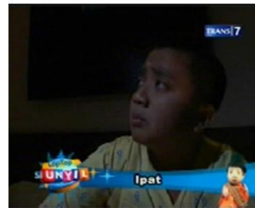
Gambar. 8 : Karakter Utama pada Sekuen Drama Si Unyil dan Ipat dengan Tema "Mati Lampu"

Ipat merupakan karakter utama manusia yang dipergunakan dalam sekuen kedua program acara ini. Karakter Ipat menjalankan cerita dari awal hingga akhir sekuen. Tokoh utama ini digambarkan sebagai pihak protagonis. Ipat digambarkan sebagai sosok anak usia sekolah dasar yang memiliki ciri fisik berupa : memiliki rambut yang cepak, mata lebar, dan bertubuh gempal. Pakaian