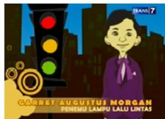
Gambar. 14: Karakter Pendukung pada Sekuen Animasi “Lampu Lalu Lintas”

Karakter pendukung yang dipergunakan dalam sekuen ini adalah Garret Augustus Morgan yang digambarkan sebagai karakter animasi dua dimensi. Karakter pendukung ini menggerakkan cerita melalui pemecahan permasalahan naratif. Garret Augustus Mor-