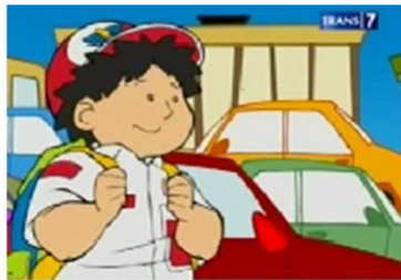
Gambar. 13: Karakter Utama pada Sekuen Animasi “Lampu Lalu Lintas”

Karakterisasi non fisik Si Unyil dalam sekuen ini digambarkan seperti karakterisasi sebelumnya. Karakter Si Unyil dalam sekuen ini berfungsi untuk menjalankan cerita melalui serangkaian masalah naratif yang diciptakan dalam segmen ini.