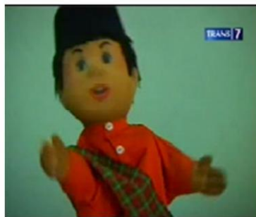
Gambar. 6 : Karakter "Si Unyil" pada Sekuen Reportase Listrik Tenaga Sampah

Karakterisasi Si Unyil dalam sekuen ini dipergunakan untuk mendukung karakter Si Unyil sebagai pembawa acara dalam program non fiksi (format program acara magazine ). Pembawa acara sebuah tayangan non fiksi tentunya harus mewakili karakter yang cerdas, memiliki rasa ingin tahu, dan memiliki familiaritas dengan pemirsanya.