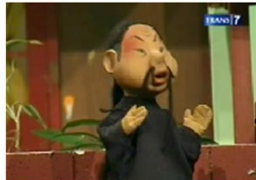
12 : Karakter Pendukung 2 pada Sekuen Drama Panggung Boneka dengan tema "Pak Ogah Membuat Biogas"

Karakter pendukung lain yang dipergunakan dalam sekuen ini adalah Engkoh. Engkoh hanya bertindak sebagai figuran dalam sekuen ini. Karakter boneka Engkoh digambarkan sebagai sosok kakek berusia paruh baya yang memiliki ciri fisik berupa: beretnies tionghoa, memiliki rambut panjang yang dikepang rapi, mata yang sipit, hidung yang besar, dan memiliki kumis bercabang dua yang khas. Pakaian yang dikenakannya adalah setelan chong san berwarna hitam polos. Karakter ini tidak memiliki sifat khusus yang menonjol, hanya digambarkan melalui aksentuasinya yang khas tionghoa.