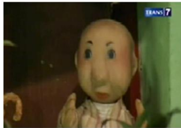
Gambar. 11 : Karakter Pendukung 1 pada Sekuen Drama Panggung Boneka dengan tema "Pak Ogah Membuat Biogas"

Karakterisasi Pak Ogah dalam sekuen ini digambarkan sebagai seorang tuna karya yang memiliki sifat malas, kurang pandai, suka meminta, namun ringan tangan. Pada "Film Boneka Si Unyil" karakter Pak Ogah sering digambarkan duduk di pos ronda dan meminta uang dari orang-orang yang lewat. Dua kalimat Pak Ogah yang paling terkenal adalah, "Ogah, aah" dan "Cepek dulu dong." Ogah adalah bahasa sehari-hari untuk mengatakan "tidak", biasanya karena kemalasan. Seiring dengan perkembangan zaman, kini istilah "Cepek dulu dong" diganti dengan "Gopek dulu dong". "Gopek" (dialek hokkian: lima keeping seratus rupiah) diminta Pak Ogah pada setiap orang yang ingin melintas ke depan pos rondanya.