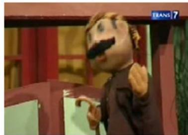
Gambar. 10 : Karakter Utama pada Sekuen Drama Panggung Boneka dengan tema "Pak Ogah Membuat Biogas"

Karakterisasi Pak Raden dalam sekuen ini digambarkan sebagai pribadi yang emosional, memiliki karakter jawa feodal yang kuat seperti: memiliki kegemaran memerintah, berkuasa, dan berlakusuka hatinya pada seseorang yang memiliki kedudukan lebih rendah di masyarakat.