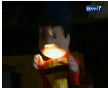
Gambar. 9 : Karakter Pendukung pada Sekuen Drama Si Unyil dan Ipat dengan Tema "Mati Lam pu"

Karakter pendukung yang digunakan dalam sekuen ini adalah Si Unyil. Unyil menggerakkan cerita melalui kelucuan yang dibangun dalam cerita. Kelucuan dibangun sebagai penggerak cerita, menggunakan karakter boneka Si Unyil yang dibuat menjadi tokoh yang usil. Sosok Si Unyil memang sengaja sedikit dirubah, bila karakterisasi terdahulunya tampak sebagai anak yang sempurna, kini sosoknya dibuat lebih manusiawi khas anak-anak yaitu sedikit jahil sebagai pertanda keakraban. Ciri fisik karakter Si Unyil yang diperlihatkan dalam sekuen ini juga tidak mengalami perubahan.