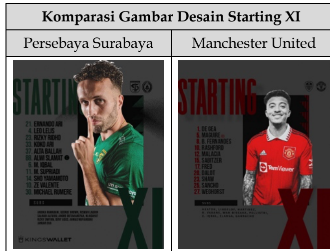
Tabel 06. Komparasi Gambar