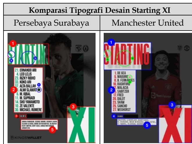
Tabel 5. Komparasi Tipografi

Terdapat persamaan variasi visual huruf dalam penggunaan teks “Starting XI”, nomor punggung, dan nama sebelas pemain, kedua klub menggunakan Sans Serif dengan variasi visual Uppercase , Condensend , dan Bold . Sedangkan perbedaan yang ditemukan dalam penggunaan bentuk huruf atau typeface , yang terlihat berbeda pada detail huruf “S” dan “R”. Selain itu ada efek bayangan jatuh pada teks “Starting XI” Manchester United yang tidak digunakan pada desain Persebaya Surabaya, penulisan teks “C” atau kapten pada desain persebaya ditulis “C” dengan tambahan bentuk lingkaran, sedangkan Manchester United hanya ditulis “(C)”, dan kombinasi typeface dari segi kelebaran hurufnya.