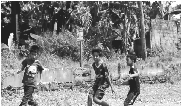
Gambar 12. Membantu teman yang sedang dikejar musuh.