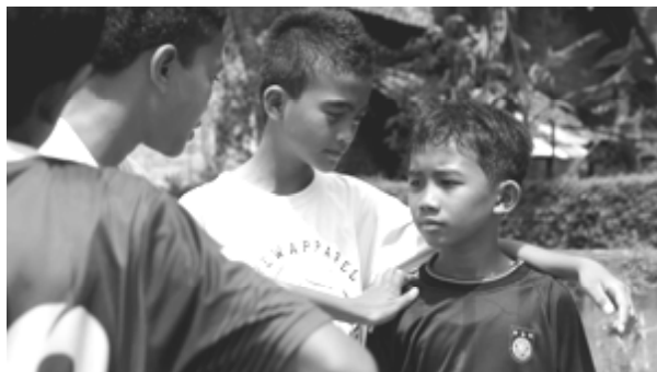
Gambar 10. Kepemimpinan.

Dalam permainan kelompok seperti jeg-jegan , sifat kepemimpinan muncul saat salah seorang anak merencanakan atau menyusun strategi dan menyusun tugas masing-masing anggotanya.