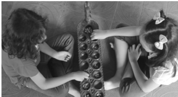
Gambar 15. Permainan Dhakon .

Selain ketelitian, ketika bermain dhakon , seorang anak juga berlatih untuk berpikir dan merancang strategi agar langkahnya tidak berhenti, sambil berusaha tetap melewati lumbung nya untuk menyimpan. Sehingga seorang anak berusaha menentukan dari mana harus memulai melangkahkan biji sawo kecik (modal) miliknya supaya berhasil melangkah seterusnya hingga akhirnya lumbung terisi penuh. (Wawancara dengan Dra. Suyami, M Hum dan Dr. Wisma Nugraha C R, Hum).