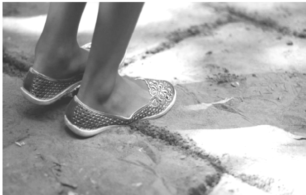
Gambar 6. Kaki seorang anak menginjak garis saat bermain engklek.

Nilai sportifitas sangat terlihat saat pemain tidak mau mematuhi aturan main atau mengakui terus terang bahwa dirinya melanggar aturan tersebut. Misalnya dalam permainan engklek ketika seorang anak melompat ternyata kakinya menginjak garis, namun tidak mau mengakui.