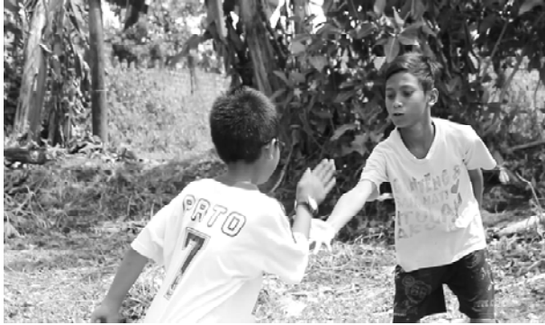
Gambar 11. Menolong teman yang tertawa.

Dalam permainan jeg-jegan , tolong menolong dan rasa setia kawan terlihat saat seorang anak menjadi tawanan kelompok lawan, maka teman yang lain berusaha menyelamatkan. Demikian juga ketika seorang anak tampak dikejar-kejar lawan, maka teman dari anak yang dikejar tadi akan berganti mengejar.