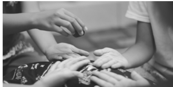
Gambar 16. Permainan cublak-cublak suweng .

Seorang anak yang bermain cublak-cublak suweng akan berlatih bernyanyi bersama karena bentuk permainannya diawali dengan menyanyikan lagu secara bersama-sama sesuai dengan ketukan yang dilakukan salah satu anak, dengan cara menyentuhkan batu kerikil pada telapak tangan masing-masing pemain secara berurutan dengan gerakan memutar. (Wawancara dengan Dr. Wisma Nugraha C R, Hum)