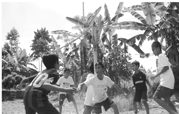
Gambar 9. Kerjasama dan tanggung jawab.

Nilai Kerjasama dalam permainan " Jeg-jegan " sangat terlihat ketika anggota satu kelompok berusaha mengepung dan menduduki benteng lawan. Rasa tanggung jawab sangat terlihat ketika masing masing anak diharuskan melakukan tugas untuk menyelamatkan bentengnya agar tidak direbut musuh.