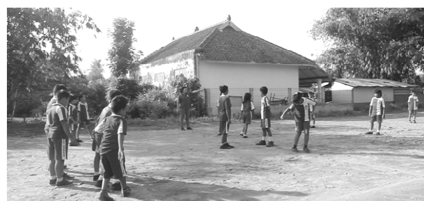
Gambar 18. Anak-anak SD belajar permainan gobak sodhor .