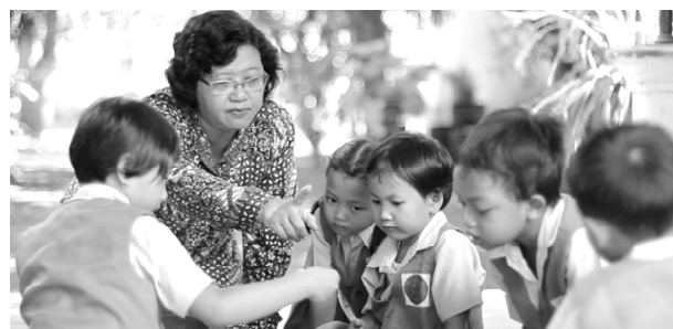
Gambar 17. Anak-anak TK belajar permainan dhakon .

Sebagai penutup dalam segmen ini Heddy Shri Ahimsa menerangkan bahwa usaha untuk melestarikan permainan tradisional sangat penting dilakukan. Dalam kondisi saat ini salah satu cara yang bisa dilakukan dan memungkinkan untuk melestarikan permainan tradisional ialah melalui pendidikan di sekolah. Di segmen ini ditunjukkan pula bagaimana guru di sekolah taman kanak-kanak, dan guru sekolah dasar mengajarkan dan memperkenalkan permainan tradisional kepada murid-muridnya.