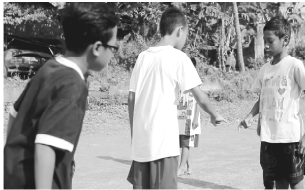
Gambar 8. Dua anak sedang melakukan ping sut.

Nilai Demokrasi bisa dilihat saat awal mula bermain ketika anak menerima siapa yang mendapat giliran bermain dan memilih kelompoknya. Cara tersebut adalah contoh demokrasi sederhana yang sudah disepakati oleh kalangan anak-anak. Biasanya anak-anak melakukannya dengan cara hompi-pa atau ping sut . Dalam hal ini ditunjukkan pada permainan jeg-jegan .