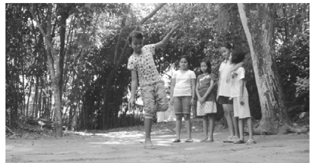
Gambar 14. Melatih keseimbangan pada permainan engklek .

Beberapa jenis permainan tradisional mempunyai manfaat melatih tubuh fisik, antara lain: melatih otot tubuh karena terus bergerak, berlari, melompat serta sekaligus melatih kelenturan tubuh dan keseimbangan tubuh. Permainan tradisional yang sering menggerakkan tubuhnya, antara lain permainan " Jeg-jegan ". Aturan permainannya memang mengharuskan anak untuk berlari saling mengejar dan menghindari dari kejaran lawan. Sedangkan permainan yang melatih kelenturan, keseimbangan, dan melatih ketepatan sasaran ada pada permainan engklek . Sesuai peraturannya, masing-masing anak harus melompat dengan satu kaki. Selain itu anak juga berlatih cara memperkirakan dan berlatih ketepatan, karena anak harus berusaha memasukkan benda dengan cara melempar ke dalam kotak dari jarak jauh, bahkan tanpa melihat obyek sasarannya. (Wawancara dengan Dr. Wisma Nugraha C R, Hum)