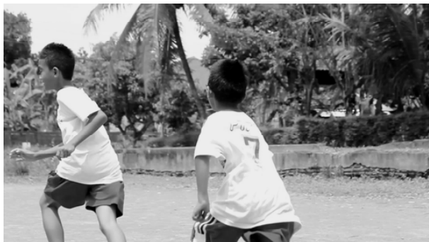
Gambar 7. Anak tetap berlari meskipun telah tersentuh lawannya.

Apabila seorang anak tidak sportif atau berlaku tidak jujur maka sebagai konsekwensinya akan mendapat sanksi sosial dengan tidak boleh ikut lagi bermain atau dijauhi teman-temannya. Dalam film ini, selain permainan engklek , sportifitas juga ditunjukkan dalam permainan jeg-jegan ketika seorang anak yang sudah berhasil dipegang tidak mau mengakui.