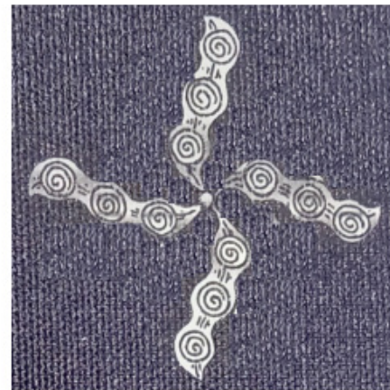
Rajah 7. detail 5

Dalam ornamen Klitikan Cyintok , ornamen jika dilihat secara tegak lurus dari bahagian atas bidang ornamen dari sisi arah pergerakan ornamen, dari pusat ornamen terdapat gerakan yang memancar seperti cahaya matahari. Ornamen dengan gerak memancar memiliki konsep seperti ornamen kipas ( fahriku naam 2019)