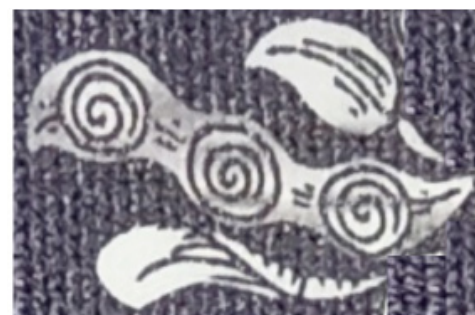
Rajah 8. detail 6

Dalam ornamen Klitikan Cyintok, ornamen jika dilihat secara tegak lurus dari bahagian atas bidang ornamen dari sisi arah pergerakan ornamen, dari pusat ornamen terdapat gerakan laksana putar seperti baling baling.