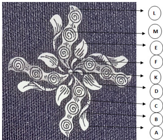
Rajah 1. klitikan Cyintok

Dalam hiasan kedua yang disebut klitikan sintok, kata klitikan itu sendiri memiliki makna berputar dalam struktur hiasan dari klitikan sintok seperti putaran berputar, dan kata sintok mewakili struktur hiasan, sebagai hasil dari unsur-unsur yang terdapat dalam Pokok sintok. Penanda: Azrul Idzwan (2019, Jun, 2)