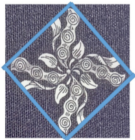
Rajah 3. detail 1

Secara umum ornamen dalam klitikan Cyintok didominasi oleh penggambaran unsur-unsur di pohon sintok, Secara umum, bentuk utama klitikan Cyintok adalah bentuk diamon/robos Pelbagai unsur tanaman ini digambarkan dengan sempurna oleh daun, batang, bunga dan akarnya. Tidak ada bahagian tanaman yang menonjol dalam ornamen pusingan Klitikan Cyintok. Semua bahagian digambarkan sedemikian rupa sehingga tidak ada yang istimewa dari ornamen ini, selain penggambaran semula jadi tumbuhan sintok.