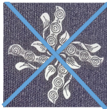
Rajah 4. detail 2

Variasi penggambaran adalah tunggal, di mana hanya tanaman sintok yang menjadi objek penggambaran ornamen. Walau bagaimanapun, terdapat beberapa variasi gambarannya yang layak dijelaskan/terangkan dalam unsur ornamen Klitikan Cyintok ini, termasuk variasi penggambaran buah sintok, buah sintok mekar yang terdapat di bahagian atas, bawah dan kanan dan kiri serta unsur lain yang ada dalam perincian ornamen.