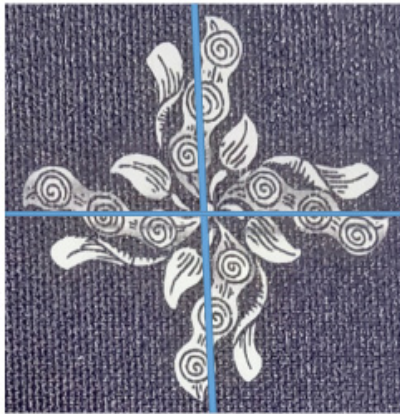
Rajah 5. detail 3

Secara umum, susun atur unsur-unsur dalam ornamen Klitikan Cyintok adalah simetris dan seimbang antara sisi kanan dan sisi kiri, serta sisi bawah dan sisi atas berdasarkan garis khayalan pembahagi. Keseimbangan ini tentu sarat akan makna religius ( fahriku naam 2019)