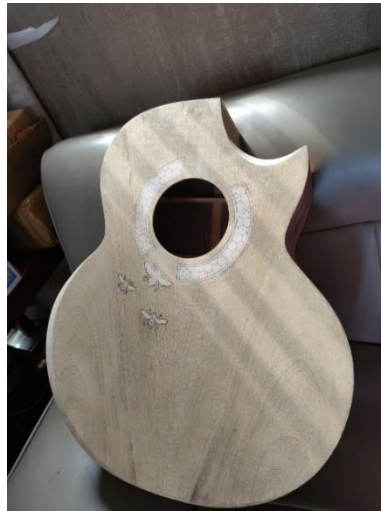
Gambar 2: Sketsa kasar motif batik

Proses pembuatan batik pada gitar produksi Batiksoul menggunakan teknik batik tulis. batik tulis merupakan hasil dari proses produksi yang dibuat secara manual menggunakan tangan dengan alat bantu canting untuk menorehkan malam. Pada proses membatik pada gitar diawali pada gambaran bentuk bidang motif utama dan motif pendukung yang mampu menghasilkan suatu goresan garis. Proses selanjutnya setelah membatik bagian bentuk motif utama dan motif pendukung adalah pengisian isen-isen pada bidang yang kosong dan penyempurnaan detail.