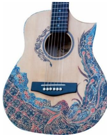
Gambar 7: Gitar motif Cendrawasih Banyu Biru

Struktur penempatan motif Cendrawasih Banyu Biru disusun secara acak, namun tetap mengikuti pola bentuk badan gitar. Penempatan motif Cendrawasih Banyu Biru produksi Batiksoul secara acak dapat diamati dari bentuk motif utama burung cendrawasih yaitu berada di bawah dengan posisi vertikal dan juga penempatan motif pendukung lainnya yaitu motif mega mendung, motif kawung serta motif tumbuhan bunga yang berada dalam posisi pinggir badan gitar. Kesan unity atau kesatuan antar motif ini kurang cukup kuat karena tidak adanya repetisi ornamen lain yang bisa memenuhi bidang badan gitar secara keseluruhan. Tidak terdapat repetisi pada motif Cendrawasih Banyu Biru, namun menciptakan penyusunan objek mengikuti bentuk dari badan gitar. Penonjolan (dominance) dalam motif Cendrawasih Banyu Biru terletak pada burung cendrawasih terutama yang memiliki bulu ekor panjang berwarna biru sesuai dengan habitat asli burung cendrawasih biru yang disatukan dengan warna oranye dan merah yang memiliki kesan sedikit tidak kontras. Motif ini tergolong memiliki jenis keseimbangan asimetris dimana setiap unsur memiliki bentuk yang tidak sama sehingga terdapat banyak variasi yang membuat motif ini terlihat rumit.