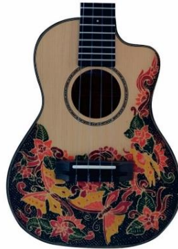
Gambar 8: Gitar motif Kupu-kupu

Struktur penempatan kupu-kupu produksi Batiksoul disusun secara acak tanpa mengikuti pola tertentu. Penempatan secara acak dapat diamati dari adanya tumbuhan berupa bunga dan daun tersebar di badan gitar. Kesan unity atau kesatuan antar motif kurang cukup kuat karena tidak adanya repetisi ornamen lainnya yang memenuhi bidang badan gitar. Pada motif kupu-kupu ini tidak terdapat adanya repetisi, namun penyusunan objek secara terpusat, serta sama bentuk dan arah satu sama lain. Penonjolan ( dominance ) dalam motif kupu-kupu terletak pada bagian sayap kupu-kupu yang berwarna orange , dan kuning menonjol yang senada jika dipadukan dengan biru tua. Warna biru tua pada motif ini sebagai latar belakang dari motif kupu-kupu produksi Batiksoul. Motif kupu-kupu produksi Batiksoul ini tergolong memiliki jenis keseimbangan asimetris dimana setiap unsur memiliki bentuk yang tidak sama dan sederhana namun dinamis.