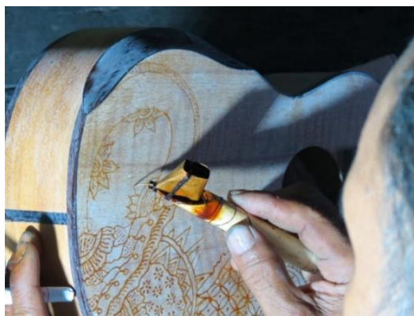
Gambar 3: Proses membatik pada gitar produksi Batiksoul

Proses pembuatan batik pada gitar produksi Batiksoul menggunakan teknik batik tulis. batik tulis merupakan hasil dari proses produksi yang dibuat secara manual menggunakan tangan dengan alat bantu canting untuk menorehkan malam. Pada proses membatik pada gitar diawali pada gambaran bentuk bidang motif utama dan motif pendukung yang mampu menghasilkan suatu goresan garis. Proses selanjutnya setelah membatik bagian bentuk motif utama dan motif pendukung adalah pengisian isen-isen pada bidang yang kosong dan penyempurnaan detail.