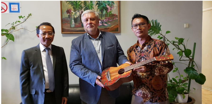
Gambar 1: Penyerahan Gitar Batiksoul di Museum Moskow, Rusia