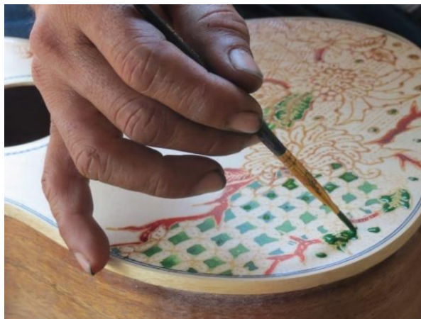
Gambar 4: Proses pewarnaan pada gitar produksi Batiksoul

Para pembatik pada proses penyempurnaan motif batik pada gitar produksi Batiksoul diberi kebebasan berimprovisasi ketika membatik sehingga desain-desain awal yang dirancang oleh Guruh Sabdo, sehingga hasil jadi banyak terdapat penambahan elemen yang menambah nilai estetis. Langkah setelah penyempurnaan motif batik yaitu proses pewarnaan. Proses pewarnaan yang dilakukan dengan teknik coletan menggunakan kuas. Bahan pewarna yang digunakan Batiksoul adalah sintesis dan alami. Tahap terakhir dari proses pembuatan batik pada gitar produksi Batiksoul setelah melakukan proses pewarnaan adalah proses pelorotan. Proses pelorotan adalah proses menghilangkan lapisan malam yang menempel di permukaan badan gitar agar terbentuk motif batik yang didapat ketika sudah adanya proses pewarnaan. Batiksoul melakukan proses pelorotan dengan mencampurkan bahan khusus ke badan gitar, setelah itu dikeringkan dan diberi finishing berupa melamin.