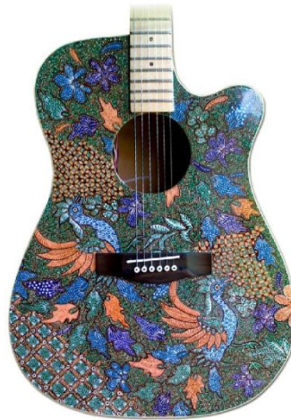
Gambar 6: Gitar motif Merak Manis

burung merak dibuat mendekati warna pada merak pada alam nyata yaitu hijau dan biru, namun dengan penambahan warna jingga pada sayap yang tidak dimiliki oleh warna merak pada alam nyata. Penerapan warna-warna pada motif Merak Manis produksi Batiksoul ini menggunakan bahan pewarna sintetis berupa remasol.