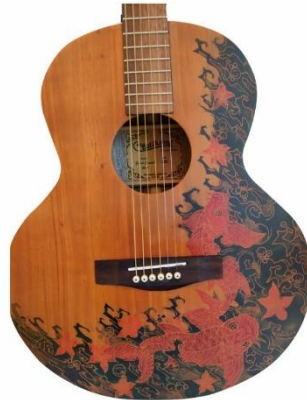
Gambar 5: Gitar motif Ikan Koi

Warna-warna yang digunakan pada Motif Ikan Koi produksi Batiksoul adalah warna sekunder yaitu orange , warna primer merah, kuning dan biru, namun secara keseluruhan Motif Ikan Koi didominasi warna biru. Warna biru melambangkan perasaan dan pikiran yang tenang. Warna pada motif utama yaitu ikan koi dibuat mendekati warna pada koi pada alam nyata yaitu merah.